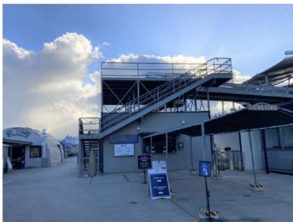
チケット販売窓口の左側を通過