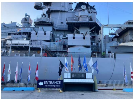
ミズーリの手前で左へ