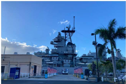
メインゲート内側からミズーリを見た写真

○メインゲート通過後、戦艦に向かってお進みください。戦艦の手前にて左折すると 50mほど先に「チケット販売窓口」があります。すでにチケットをお持ちの場合は、 窓口の左側をさらにお進みください。